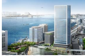
Left: Main Building Right: Satellite Office