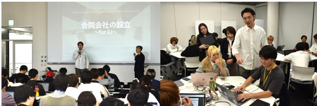
起業に挑戦する授業「イノベーションプロジェクト」の様子